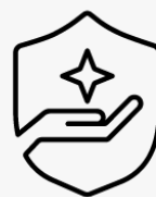
3 Jahre Abhol- und Lieferservice UM946E