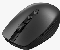
HP 710 Wiederaufladbare geräuschlose Maus 6E6F2AA