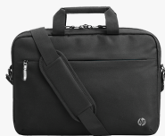
HP Professional 14,1 Zoll Laptop-Tasche 500S8AA