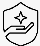
3 Jahre Abhol- und Lieferservice UM946E